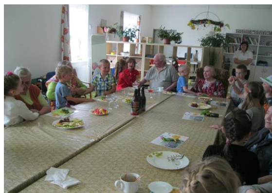
DpS - projekt Mezi námi