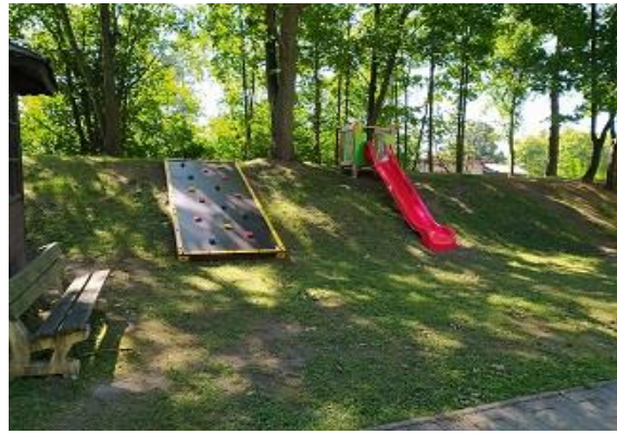
Horolezecká stěna a skluzavka