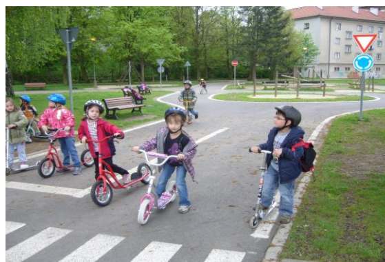
Dopravní hřiště v Táboře