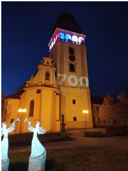
700 let Bechyně