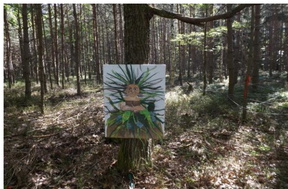
Cesta pohádkovým lesem