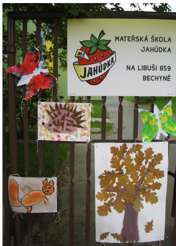
Galerie na plotě