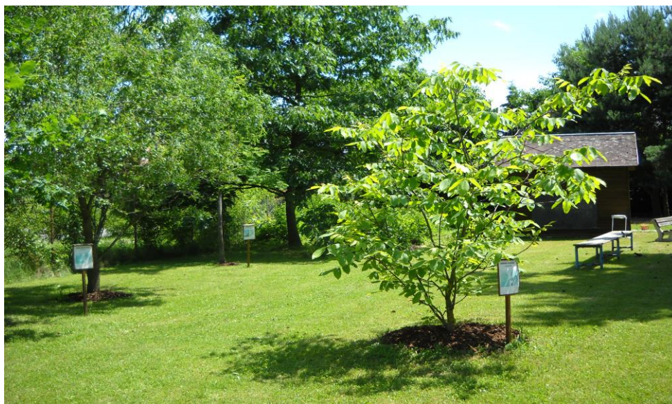
Naučná stezka Od stromu ke stromu

Podmínky naší mateřské školy, školní zahrady i blízkého okolí umožňují ekologickou výchovu nenásilně zařazovat do všech denních činností, neboť se dá reagovat na okamžité situace. Jde o prožívání konkrétního pozorování a pokusů přímo v přírodě (s lupou, dalekohledem apod.). Již několik let pracují naše učitelky s projekty environmentální výchovy, které průběžně aktualizují a vytvářejí stále nové – viz Seznam projektů.