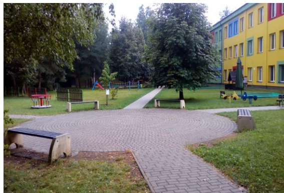
Kruhový objezd na zahradě MŠ