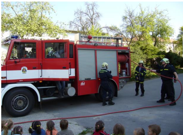
Simulovaný požární poplach