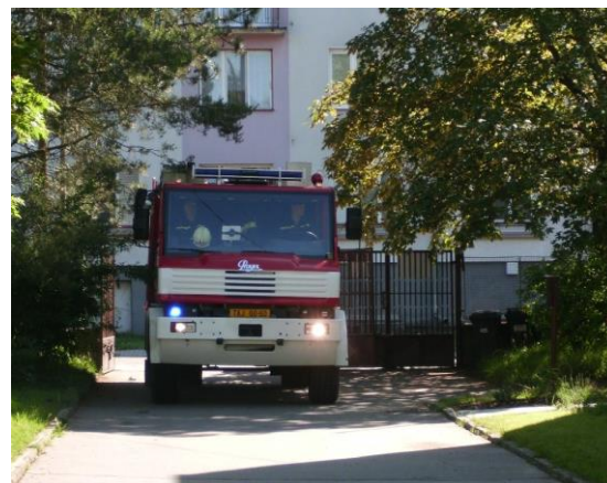
Příjezd hasičů do MŠ